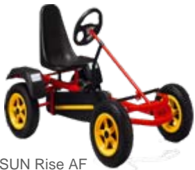
SUN Rise AF