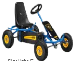
Sky light F