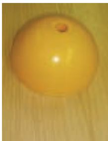
Base de los Palos

Incluye 16 aros de 40 cm de diámetro, 8 palos de 120 cm de alto, red de 240 cm x 180 cm con los clavos para sujetarla al suelo y 2 sacos de 112 cm x 75 cm. Se entrega en dos bolsas de lona cerradas con cremallera. Ref.: GG50232